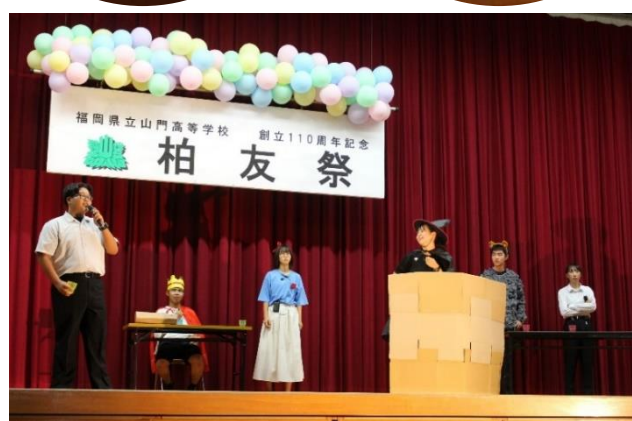
「白雪姫殺人事件(劇)」大いに盛り上がりました