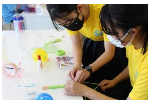
パラコードでプレスレット作り