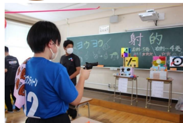
「夏祭り」をテーマにした縁日もありました