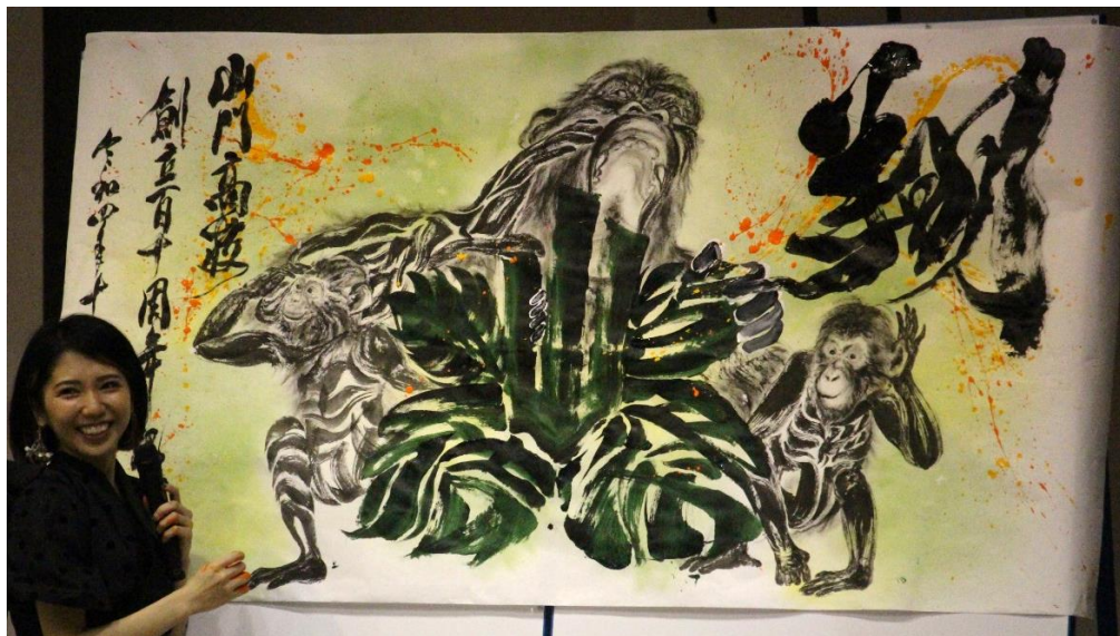
本校の校章を、今年度の大運動会のテーマである「一結皆翔」の文字で描かれています 3匹の猿は校訓である「至誠」「信愛」「創造」の文字で描かれています

講演後の書道パフォーマンスでは、ことわざの「見ざる・聞かざる・言わざる」に因んで、ご自身が大切にされている「よく見る・よく聞く・よく話す」の三猿をご披露いただきました。