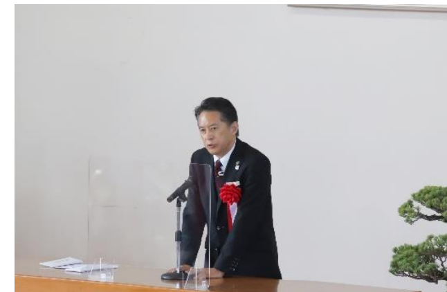
来賓祝辞 福岡県議会議員 板橋 聡 様